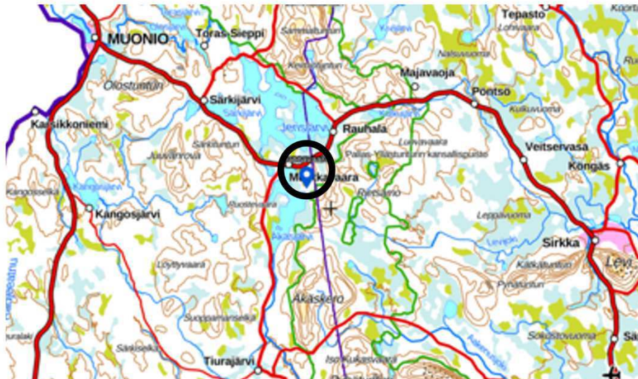
Kuva 1. Sijainti Muonion kunnassa

Alueella ei ole rakennuksia tai rakennelmia.