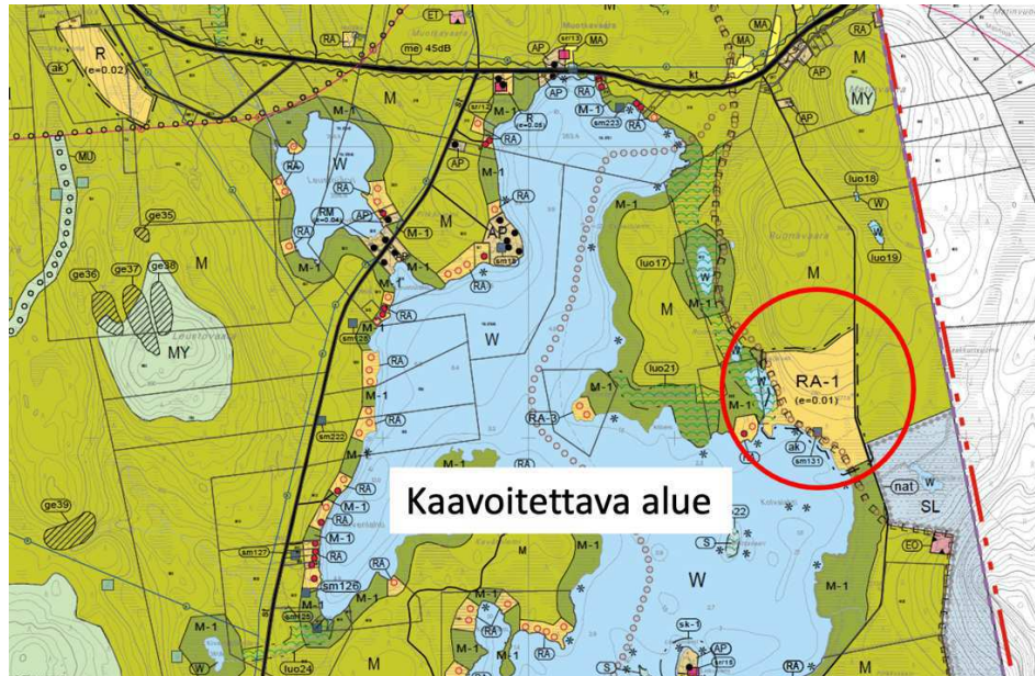
Kuva 3. Karttaote osayleiskaavakartasta, jossa osoitettu kaavoitettava alue punaisella ympyrällä.

Kaavoitettava määräala on voimassa olevan osayleiskaavan mukaista loma-asuntoaluetta (RA-1). Alue on tarkoitettu ei-omarantaisten loma-asuntojen rakentamiseen.